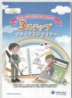
3ステップマネープランセミナー(約90分)

老後の主な収入となる公的年金制度の仕組みや給付内容等の説明。資産作り・運用で気をつけるべき事の説明や退職後のリスク等について説明します。