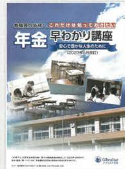
年金早わかり講座 (30分～40分)

老後収入の柱となる公的年金。その仕組みや給付内容、その他少子高齢化が進む中での今後の課題などを説明します。