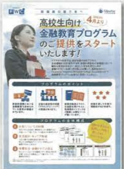
高校生向け金融教育プログラム(約50分)

激変する時代に備えるために必要なマネー知識。変化への対応、安心への備えに向けて、健康保険制度等の最新動向、相続・贈与や資産運用の基礎知識等について説明します。