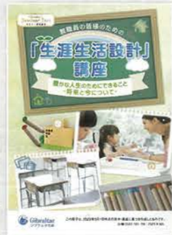
生涯生活設計講座 (約1時間)

老後収入の柱となる公的年金。その仕組みや給付内容、その他少子高齢化が進む中での今後の課題などを説明します。