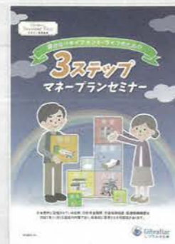
3ステップマネープランセミナー(約90分)

老後の主な収入となる公的年金制度の仕組みや給付内容等の説明。資産作り・運用で気をつけるべき事の説明や退職後のリスク等について説明します。