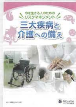
三大疾病と介護への備え (約30分)

老後収入の柱となる公的年金。その仕組みや給付内容、その他少子高齢化が進む中での今後の問題点などを説明します。