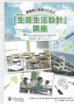
生涯生活設計講座 (約1時間)

長寿社会が進む現在。死亡率が下がる一方、身体のどこかに障害が残る介護生活も…。これだけは知っておきたい社会保障制度の現状と今後の備えについて説明します。