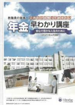
年金早わかり講座 (30分～40分)

老後収入の柱となる公的年金。その仕組みや給付内容、その他少子高齢化が進む中での今後の問題点などを説明します。