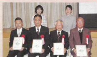
助成団体への目録贈呈